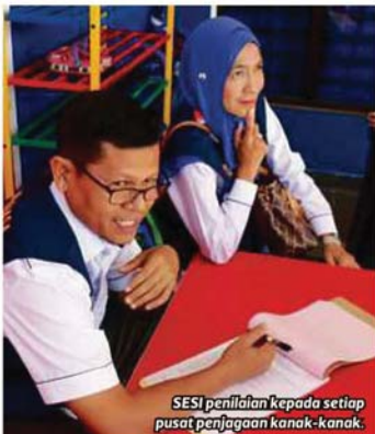
SESI penilaian kepada setiap pusat penjagaan kanak-kanak.

Operasi yang diadakan MBSA ini turut mendapat kerjasama agensi berkaitan seperti Jabatan Kebajikan Masyarakat Negeri Selangor, Jabatan Agama Islam Selangor, Jabatan Kesihatan Negeri Selangor dan Polis Diraja Malaysia.