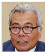
MENTER TUGAS-TUGAS KHAS Datuk Seri Mohd Redzuan Md Yusof