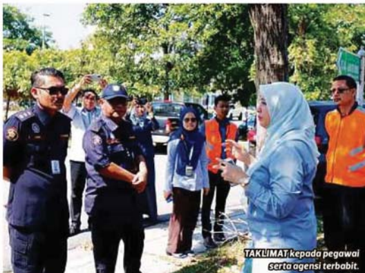
TAKLIMAT kepada pegawai serta agensi terbabit.