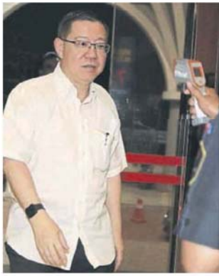
↑林冠英抵达会场时接受工作人员检测体温。