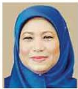
MENTERI PELANCONGAN, KESENIAN DAN KEBUDAYAAN Datuk Seri Nancy Shukri