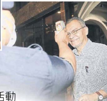
→祖基菲里阿末抵达会场时，接受工作人员测量体温。