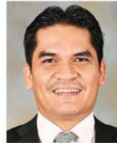
教育部高级部长 莫哈末拉兹博士