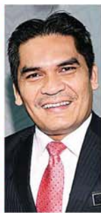
新任教育部长莫哈末拉兹。