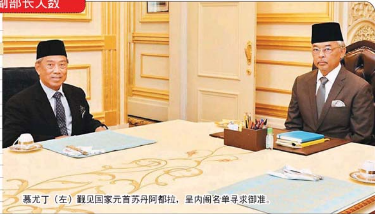
慕尤丁(左) 覲见国家元首苏丹阿都拉，呈内阁名单寻求御准。

部长分别为国际贸易及工业部长拿督斯里阿兹敏阿里、国防部长拿督斯里依斯迈沙比里、工程部长拿督斯里法迪拉以及教育部长莫哈末拉兹。