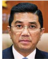
国际贸易与工业部高级部长 拿督斯里阿兹敏阿里