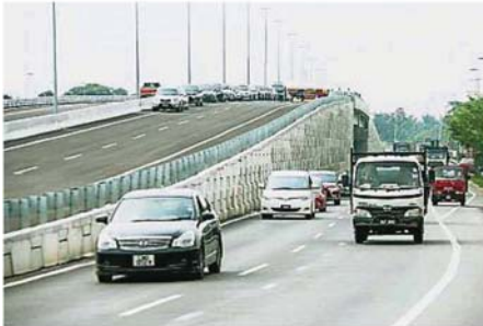
从布城往沙叻丁宜的替代道路，将在3月杪正式通车。