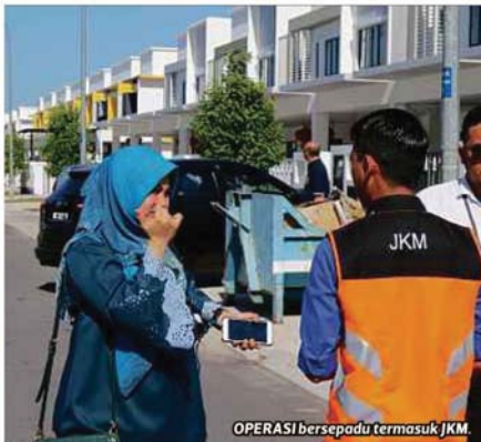
OPERASI bersepadu termasuk JKM.

ini diadakan untuk memastikan pengusaha tadika atau taska dan pusat jagaan mematuhi syarat ditetapkan MBSA.