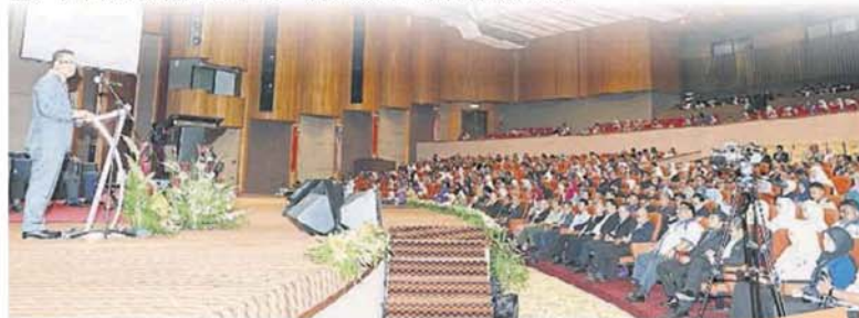
■阿米魯丁出席雪州政府常月會議，向州政府官員及職員訓話。

他們曾在布城召開記者會表明支持雪州希盟，他們珍惜選民們在2018年全國大選時給予他們的支持，因此支持希盟尤其是雪州希盟。