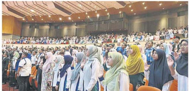
雪州公务员受促以专业态度，继续履行任务。