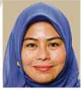
MENTERI PENGAJIAN TINGGI Datuk Dr Noraini Ahmad