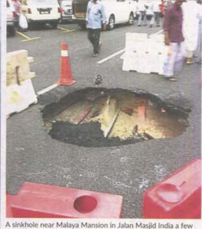
A sinkhole near Malaya Mansion in Jalan Masjid India a few years ago was believed to have been caused by pipe repair works by a utility company.