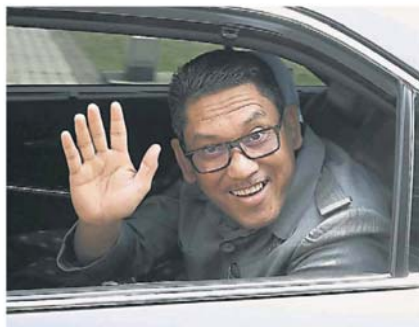
刚在昨日宣布土团党及巫伊 2 党组织露雳州新政府的阿末法依查昨日下午也前往首相官邸。

“作为首相，我有责任成立一个可以解决人民问题，并为我国发展带来更大辉煌的内阁。”