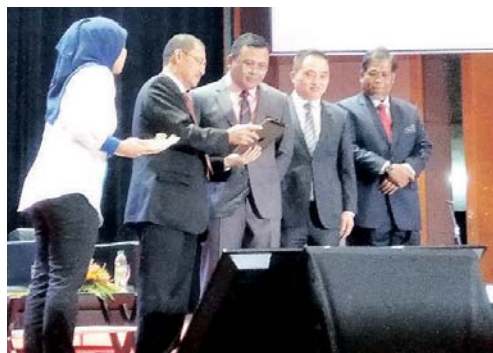
Amirudin (tiga dari kiri) ketika merasmikan Majlis Perhimpunan Penjawat Awam Negeri Selangor di Auditorium Dewan Jubli Perak, Shah Alam semalam.

Pengerusi PH Selangor, Datuk Seri Amirudin Shari berkata, beliau sudah meminta kesemua ADUN terbabit memberi