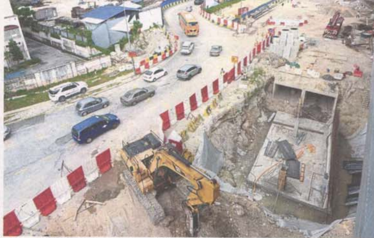
An excavator clearing earth beside a main road in Kuala Lumpur.