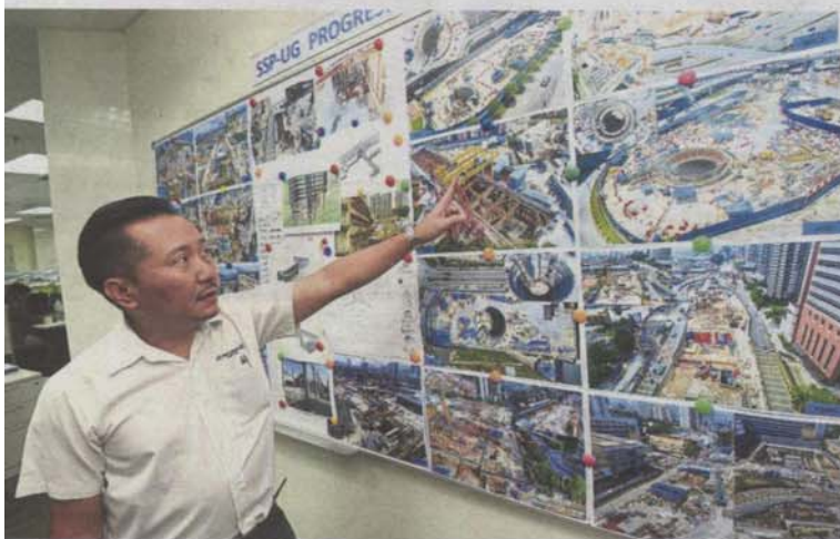
Ho says the onus is on the utility companies or service providers to update government agencies like DBKL once they have laid out their cables and pipes.