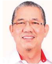
工程部高级部长 拿督斯里法迪拉尤索夫