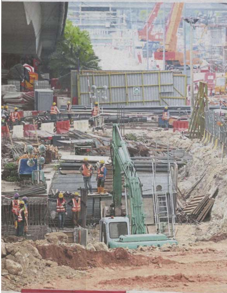
Construction work taking place near Bukit Bintang area in Kuala Lumpur.

Mayor: Current data may be inaccurate as records not up to date