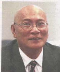
Nor Hisham says there is still a lot of data to gather as Kuala Lumpur's reticulation system is more than 50 years old.

Laws pertaining to these mappings are governed by the Street, Drainage and Building Act 1974, The Electricity Supply Act 1990, Gas Supply Act 1993, Communications and Multimedia Act 1998 and the Water Services Industry Act 2006.