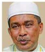
MENTERI PARLIMEN DAN UNDANG-UNDANG Datuk Takiyuddin Hassan