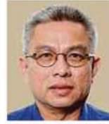
MENTERI KESIHATAN Datuk Seri Dr Adham Baba