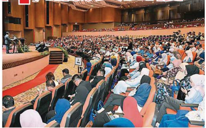
雪州公务员出席州政府常月集会, 聆听阿米鲁丁讲解在联邦政权变更后带来的影响, 以及州政府继续迈向前的斗志。

询及希盟是否能在人选方面达成一致, 他认同需有这考量, 强调他身为州务大臣, 重点是必须和有工作能力的人共事, 且人选需获得来自各方面的共识与认同。