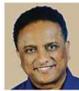
MENTERI BELIA DAN SUKAN Datuk Seri Reezal Merican Naina Merican