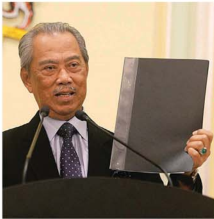
首相丹斯里慕尤丁周一宣布称为“有功能”(functional cabinet) 的新内阁阵容。

另外，首次入阁的巫统议员是能源与天然资源部长拿督三苏安努及卫生部长拿督斯里阿汉峇峇，另 3 人则来自伊斯兰党国会议员，即首相署部长(国会与法律事务)拿督达基丁、环境部长拿督依布拉克及种植与原产业部长拿督哈末凯鲁丁。