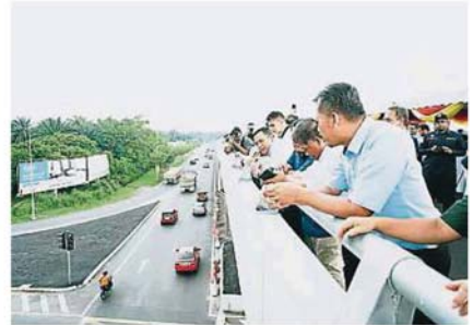
阿米鲁丁(右四)巡视即将启用的高架天桥。

他早前与雪州大臣拿督斯里阿米鲁丁一同巡视FT29/FT31路口的提升工程时，如是表示。