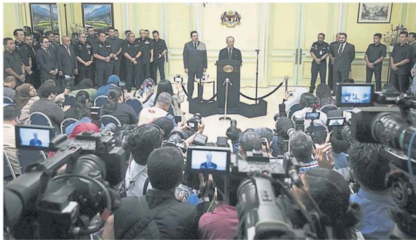
首相慕尤丁昨日在布城首相署办公厅宣布新政府内阁名单。

这 4 个高级部长分别是统管国际贸易及工业部的拿督斯里阿兹敏阿里；统管国防部的拿督斯里依斯迈沙比里；统管工程部的拿督斯里法迪拉尤索夫，以及统管教育部的莫哈末拉兹博士。