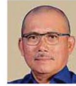
MENTERI PERTANIAN DAN INDUSTRI MAKANAN Datuk Seri Dr Ronald Kiandee