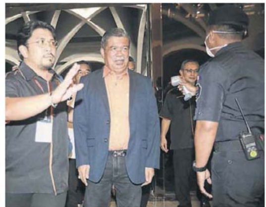
■末沙布抵达会场时笑而不语。