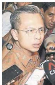
■法米在步入会场前接受媒体访问。