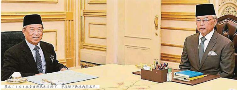
慕尤丁（左）在皇宮覲見元首陛下，尋求陛下御准內閣名單。

（布城9日讯）首相丹斯里慕尤丁今日公布国民联盟政府的内阁名单，而我国也首次没有委任副首相，反之则委任4名高级部长协助管理经济、保安、基建发展以及教育与社会事务。