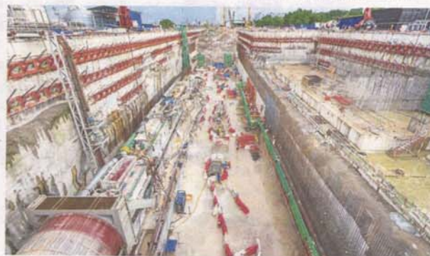
Contractors are required to scan for underground pipes and cables and relocate them before excavation work is carried out.

a Utility Mapping Division in 2006 which developed an underground utility database called Pangkalan Data Utiliti Bawah Tanah Kebangsaan, better known as Padu. However, Jupem is not a regulator but merely a repository of information comprising data of water and sewerage pipes, gas, power and telecom cables.