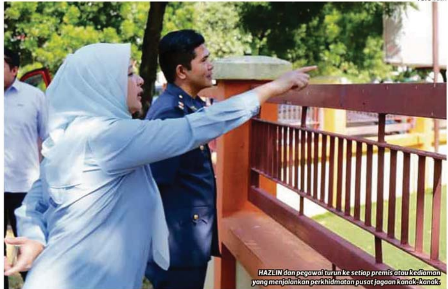
HAZLIN dan pegawai turun ke setiap premis atau kediaman yang menjalankan perkhidmatan pusat jagaan kanak-kanak