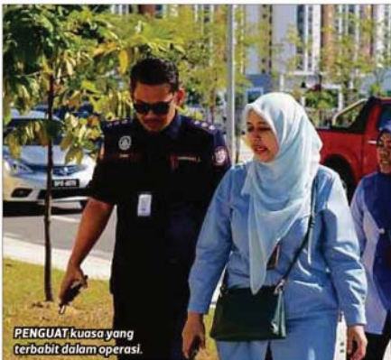
PENGUAT kuasa yang terbabit dalam operasi.