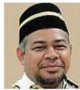
MENTERI PERUSAHAAN PERLADANGAN DAN KOMODITI Datuk Dr Mohd Khairuddin Aman