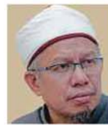
MENTERI HAL EHWAL AGAMA Datuk Seri Dr Zulkifli Mohamad Al-Bakri