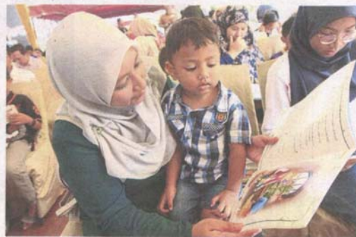
The 'Let's Read Together for 10 minutes' session saw parents and children taking time out to read a book.

MB: Allocation for translation of books to Bahasa will continue