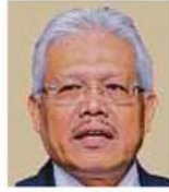
MENTERI DALAM NEGERI Datuk Seri Hamzah Zainuddin