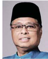
国防部高级部长 拿督斯里依斯迈沙比里