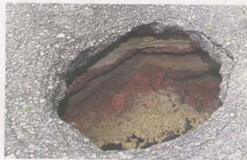
A sinkhole appeared on Jalan Tuanku Abdul Halim on October 21 last year due to a broken culvert running across under the road.

not want to be held responsible if something were to happen in the event the data that they provided is found to be inaccurate," he said, adding that most of the time the data was only 60% to 70% accurate.