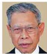
MENTERI EKONOMI Datuk Seri Mustapa Mohamed