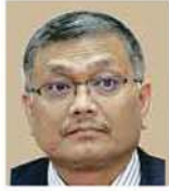
MENTERI TENAGA DAN SUMBER ASLI Datuk Dr Shamsul Anuar Nasarah