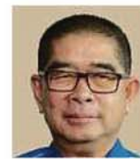
MENTERI HAL EHWAL SABAH DAN SARAWAK Datuk Seri Dr Maximus Johnnity Ongkill