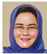
MENTERI PERPADUAN NEGARA Datuk Halimah Mohamed Sadique